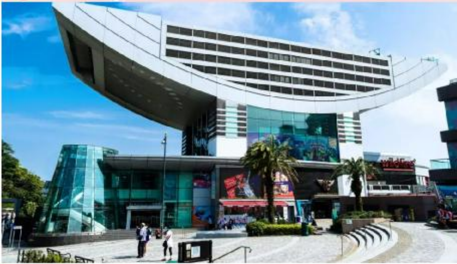
最佳公廁位於富豪地段