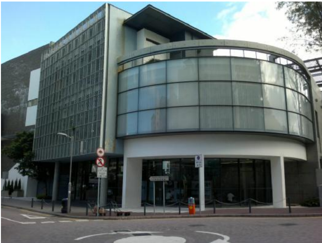
赤柱市政大廈公廁奪得「2022 香港最佳公廁選舉」銀獎

協會讚揚凌霄閣公廁符合「香港公廁設計及管理指引」的 CASH 要求，衛生環境非常良好，廁所內更安裝了四合一非接觸式概念洗手盆，環保之餘又方便使用者。