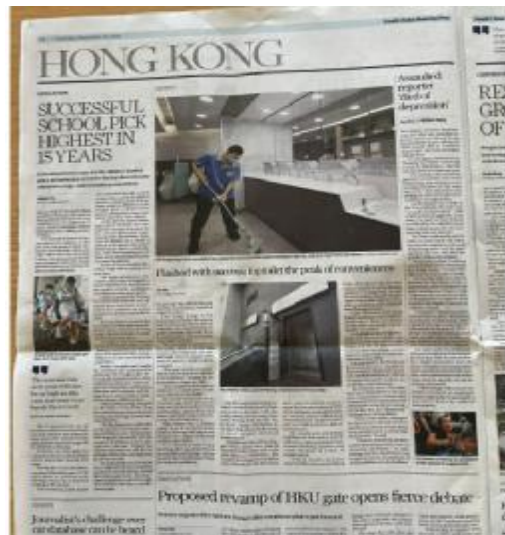
South China Morning Post