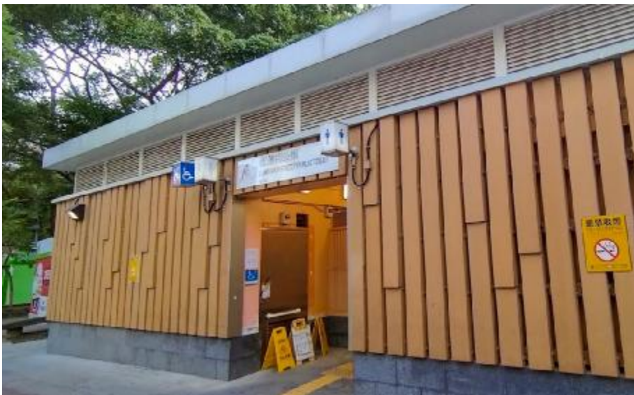
Lung Wan Street public toilets, which were said to be among the worst in the city.

“This competition is an annual reminder to stakeholders to put more effort into the matter.”