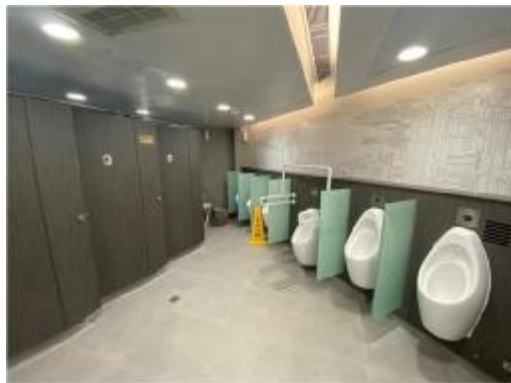
山頂凌霄閣公廁

山頂凌霄閣為選舉冠軍，協會認為該公廁衛生環境非常良好，小童坐廁等設施一應俱全，設計上更以香港景色作牆身瓷磚，十分獨特。協會亦指出郊野公園流動公廁衛生差劣問題，多年以來仍未有改善，包括設備失靈、缺乏打理、臭氣熏天，無人打理，促請政府馬上跟進此問題。