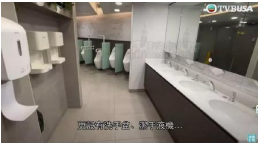
榮獲第一名公廁設備相當齊全 (圖片來源: Youtube@TVB USA Official 截圖)

最佳公廁位於富豪地段 (圖片來源: 山頂凌霄閣 官方網站) 榮獲第一名公廁設備相當齊全 (圖片來源: Youtube@TVB USA Official 截圖)