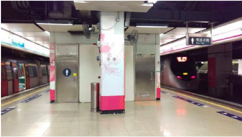
紅磡站洗手間

2022 年 7 月有一名老人家於紅磡站昏迷逾 5 小時，送院不治。香港廁所協會主席蘇金標承認現時公廁安全性上有所不足，認為政府應為公廁增設計時感應器，在約 10 分鐘後仍未使用完畢，便即時通知控制室。港鐵亦曾承諾，為免同類事件發生，將於全綫超過 90 個無障礙洗手間裝設行動感應器。