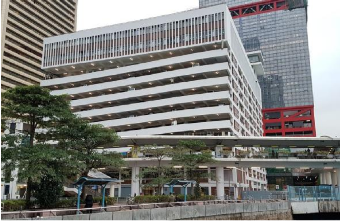
上環林士街多層停車場公廁奪得「2022 香港最佳公廁選舉」銅獎